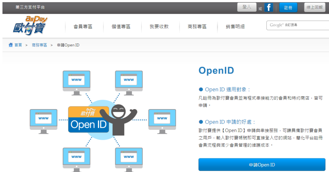
圖二、官網申請 OpenID 圖示